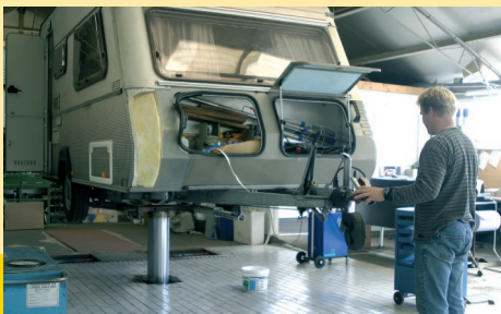
In de werkplaats werken de beide broers Hoff aan onderhoud en reparatie van caravans.

Ook niet stallingklanten komen overigens naar Caravanhoff voor onderhoud en reparatie.