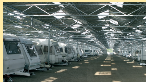
Overdekt en goed geventileerd komt de caravan in het voorjaar weer fris uit de stalling.

Voor de winteropslag adviseert Caravanhoff geen vochtvreter te plaatsen. “Deze verzamelt het water in een bak: maar dan?” Een vochtvreter in een kelder kan prima, want deze kun je naar behoefte ledigen. “In een caravan kun je beter kattenbakkorrels gebruiken, of een teiltje met enkele pakken los zout erin. Veel goedkoper en minstens zo effectief.” Andere adviezen: de horren omhoog (kan de zon de caravan