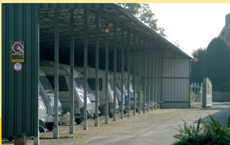
Nast de bestaande kassen pleegde Caravanhoff ook nieuwbouw voor stallingdoeleinden.

vakantie uit te laten voeren. Dat zorgt hier voor een betere spreiding van de werkzaamheden, en het is voor de klant prettiger dat de caravan zo kant en klaar uit de stalling gereden kan worden”, aldus Freek. In 1988 is Caravanhoff begonnen met het verrichten van onderhoudswerkzaamheden. In 1990 kozen vader en zoon Hoff voor het BOVAG lidmaatschap. “Die naam heeft het vertrouwen van het publiek. Het garandeert ten minste vakmanschap en de aanwezigheid van de vereiste apparatuur in de werkplaats. Beide broers hebben de vereiste diploma’s. De één houdt zich voornamelijk bezig met het bovendee van de caravans, de ander richt zich op het onderstel. “Zo kunnen we met één hefbrug steeds naast elkaar werken zonder elkaar in de weg te zitten.” Vanwege de drukte worden schadegevallen momenteel uitbesteed aan een gespecialiseerd bedrijf.